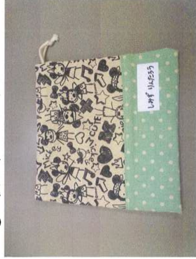
縦 20 cm位 × 横 20 cm位

☆一日保育と同時に歯磨きを実施します。園では食後の歯磨きを習慣づけようと力をいれて指導してまいります。毎日持ち帰りますので歯ブラシをよく点検して頂き週のはじめに持たせてください。ブラシの毛先が外側に広がってきたら取り替えの目安です。コップは洗って持たせてください。