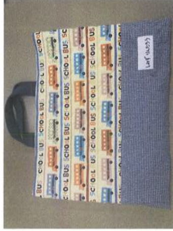
縦 3 0 cm位 × 横 4 0 cm位